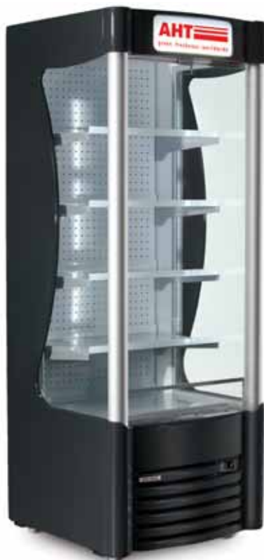
AHT AC M

*Alle Optionen auf Anfrage. Stückzahlabhängig