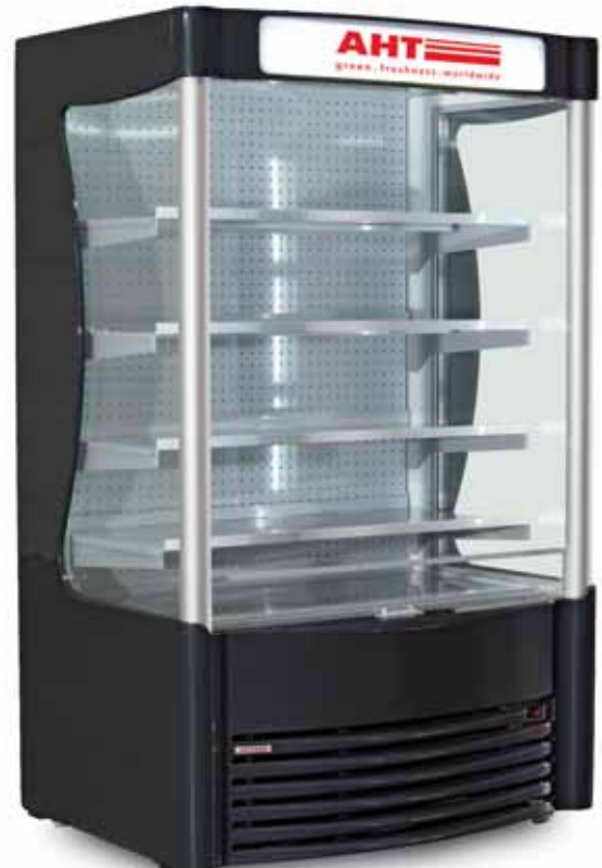
AHT AC XL

Austausch der Kühlkassette innerhalb 15 Minuten